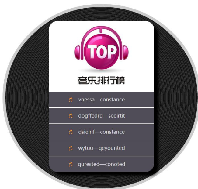
图 5-51 背景属性定义列表样式

本章前几节重点讲解了盒子模型的概念、盒子相关属性、线性渐变、径向渐变等。为了使读者更熟练地运用盒子模型相关属性控制页面中的各个元素，本节将通过案例的形式分步骤制作一个音乐排行榜模块，其效果如图 5-51 所示。