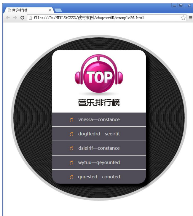
图 5-54 添加 CSS 样式后的页面效果

至此，完成了效果图 5-51 所示歌曲排行榜模块的 CSS 样式部分。将该样式应用于网页后，效果如图 5-54 所示。