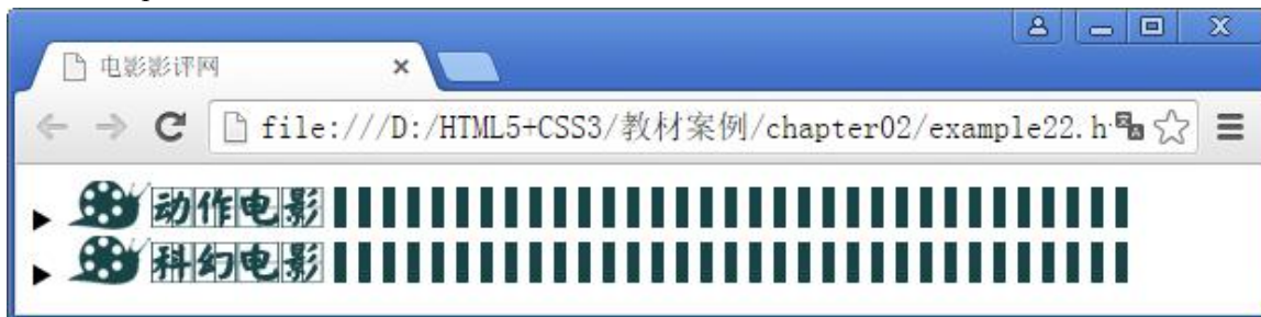
图 2-31 文章内容区域效果