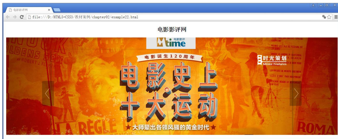
图 2-29 头部效果展示