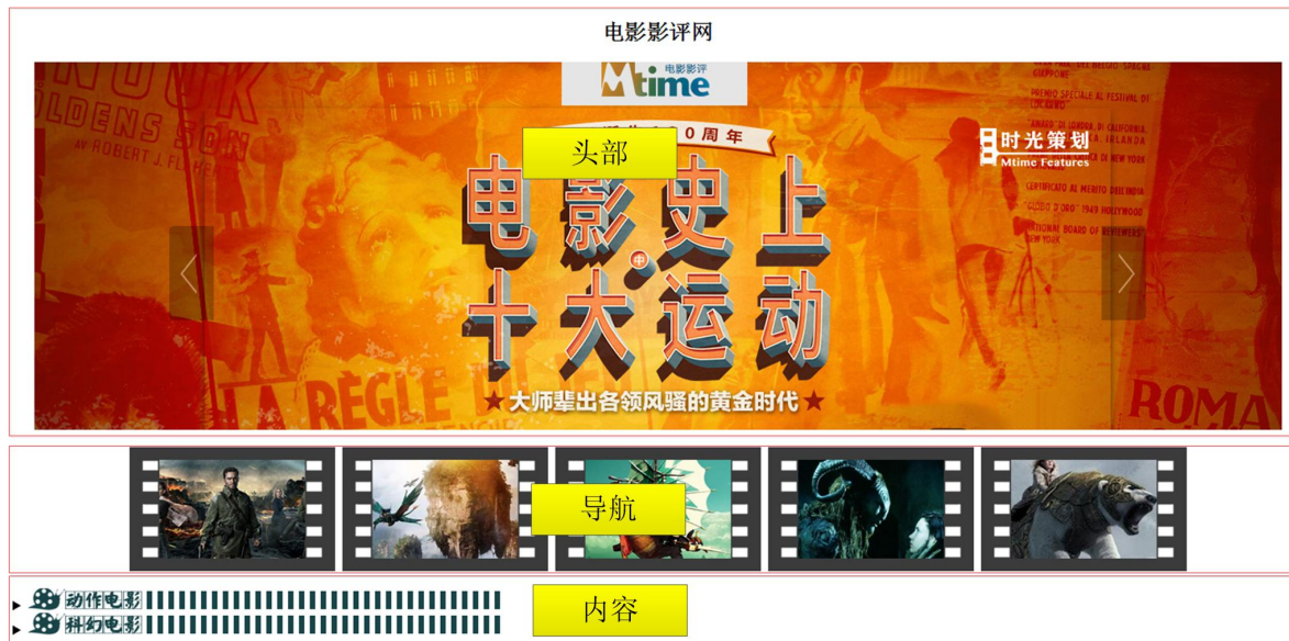
图 2-28 结构分析

其中，头部信息通过<header>元素定义，内部由<img/>标记插入图片。导航链接由<nav>元素定义，内部嵌套无序列表<ul>。文章内容由<article>元素定义，内部由<details>元素进行划分，其中动作电影、科幻电影部分均为插入的图片，由<details>元素内部的<summary>元素定义，以实现点击这两个图片时，分别显示<details>元素内部的其他内容。页面中的评分进度条效果由<meter>元素来实现。