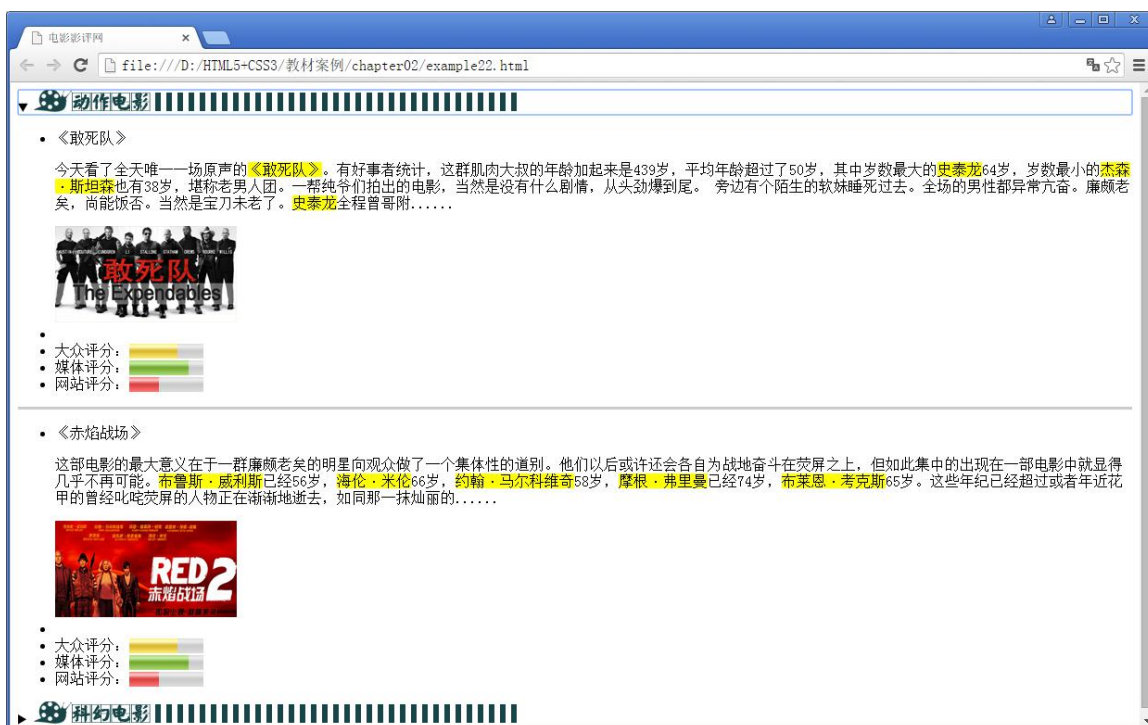
图 2-32 文章内容区域效果